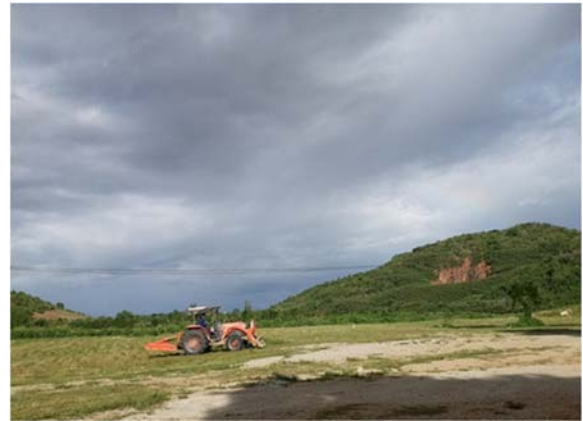
ปรับพื้นที่ลานกิจกรรมประจำโครงการ ขนาดพื้นที่ ๕ ไร่