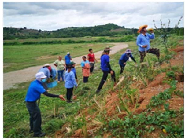
จัดตั้งกลุ่มพัฒนาป่าไม้ตามแนวพระราชดำริ จำนวน ๓๐ คน