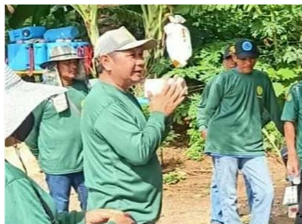
ประชาสัมพันธ์ป้องกันรักษาป่าและควบคุมไฟป่า