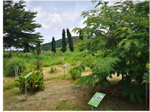
จัดทำแปลงสาธิตพืชสมุนไพร จำนวน ๑ ไร่