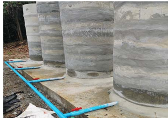
วางระบบน้ำและระบบไฟในพื้นที่โครงการ