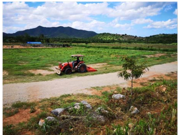
บริเวณป่าสงวนแห่งชาติ ป่าเขาพยอม อำเภอสามร้อยยอด จังหวัดประจวบคีรีขันธ์ พื้นที่ ๖๕๒ ไร่